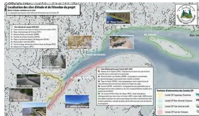
Le projet couvre la majeure partie du Saint-Laurent maritime